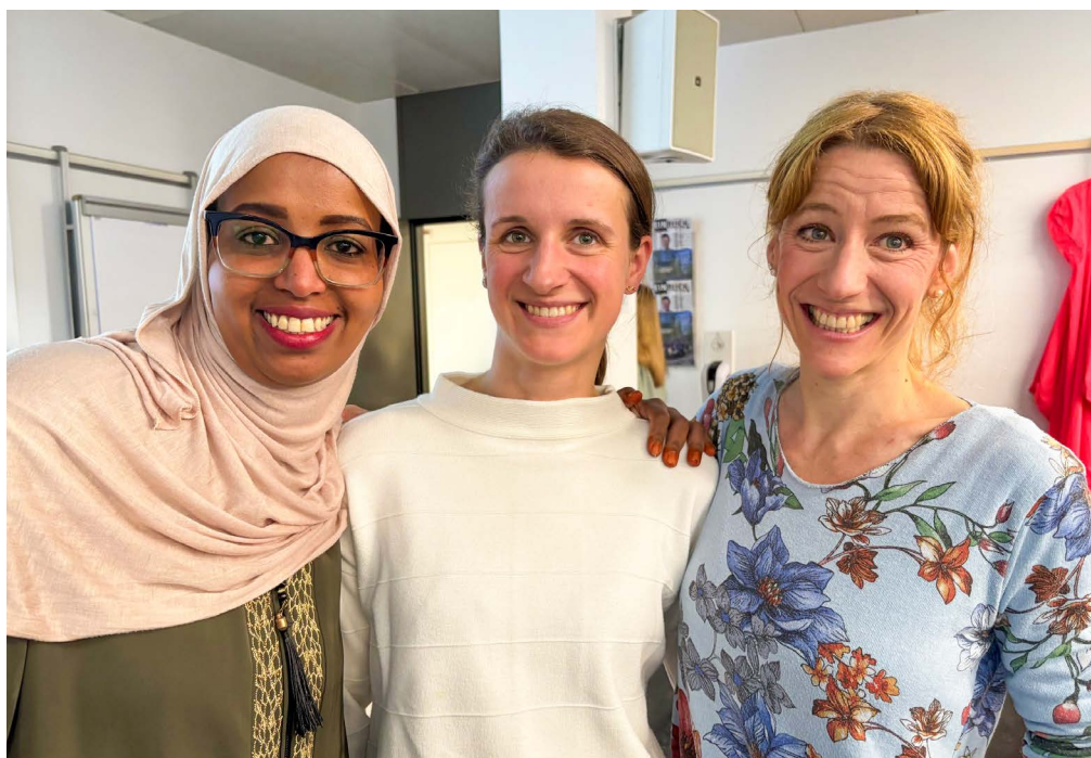
Fachveranstaltung Häusliche Gewalt, Mai 2025

Darüber hinaus führte das Netzwerk 2025 rund 15 Sensibilisierungsveranstaltungen durch. Insgesamt nahmen 364 Fachpersonen aus dem Gesundheits-, Sozial- und Migrationsbereich teil – ein erfreulich hoher Wert, denn fundiertes Wissen ist entscheidend, um Betroffene frühzeitig zu erkennen und wirksam zu unterstützen.