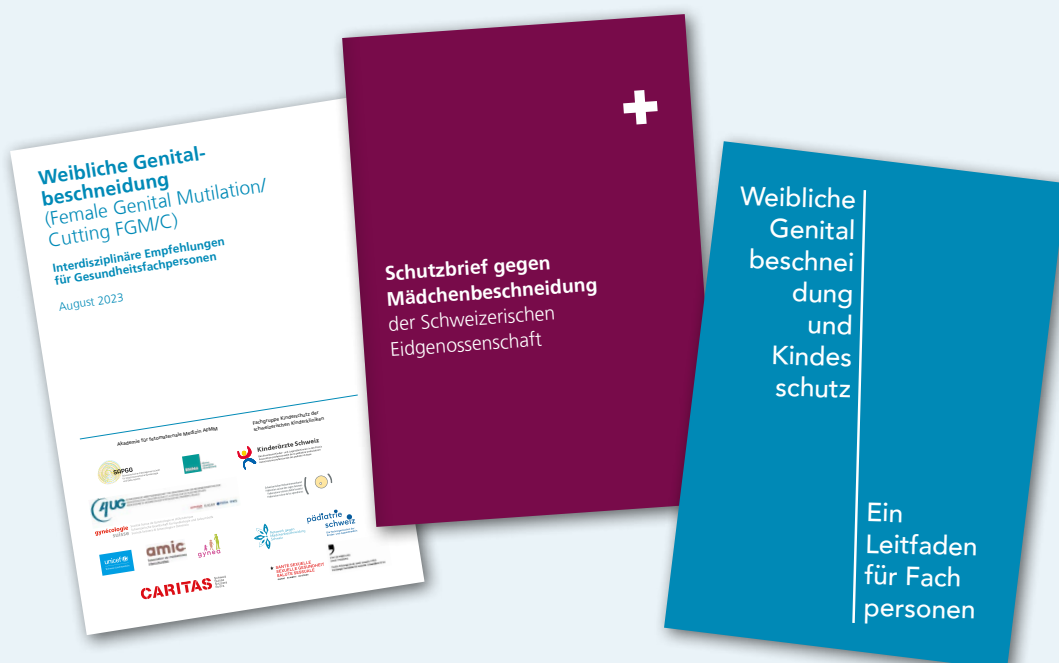
Grundlagenmaterialien zu FGM/C

Weitere Informationen und aktuelle Entwicklungen bietet die Plattform www.maedchenbeschneidung.ch . Die Website wurde 2016 in Zusammenarbeit mit Vertreter*innen verschiedener Migrationsgemeinschaften entwickelt, wird laufend aktualisiert und stellt Inhalte für Fachpersonen und Communities in sieben Sprachen bereit.